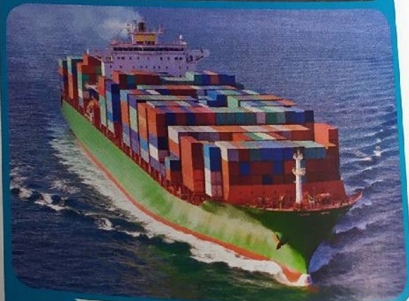
Doc. 4 Transport des bananes