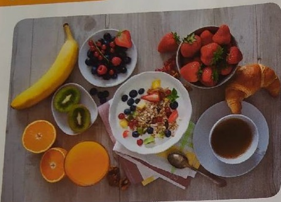
Doc. 1 Table d'un petit-déjeuner