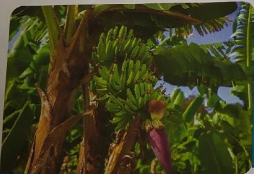
Doc. 3 Culture de bananes en Martinique

Les zones de cultures des bananes se situent dans des secteurs humides des tropiques jusqu'à 500 m d'altitude. La température doit être comprise en permanence entre 20 °C et 40 °C.