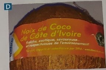
Doc. 6 Étiquettes de produits alimentaires