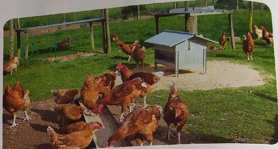
Doc. 2 Élevage de poules en plein air