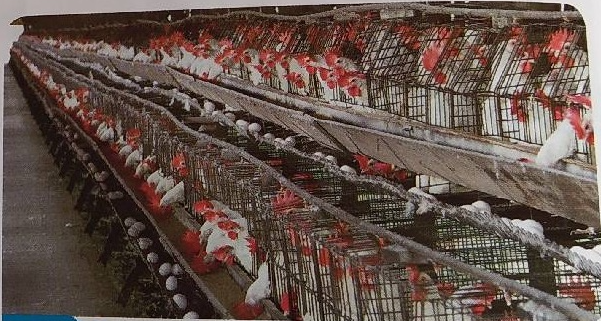
Doc. 3 Élevage de poules en cages